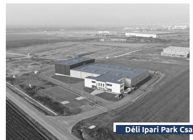
Déli Ipari Park Csarnok