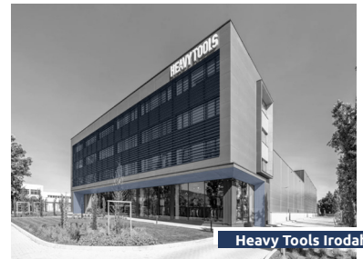
Heavy Tools Irodaház